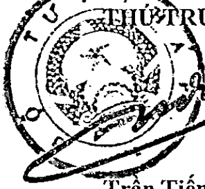
Trần Tiến Dũng

KT. CHÁNH ÁN TÒA ÁN NHÂN DÂN TỐI CAO PHÓ CHÁNH ÁN 2 o